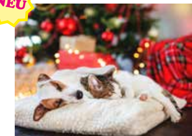
MOTIV 24-06 Hund & Katze Weihnachten