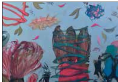
MOTIV 20-14 Die neuen Kleider des Käfers Sabine Schreckeneder