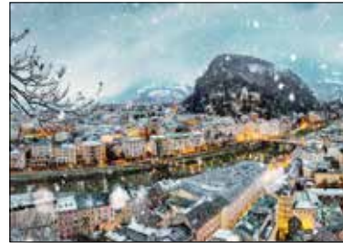
MOTIV 21-02 Winter in Salzburg | Salzachblick