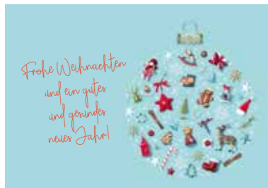
MOTIV 23-05 Weihnachtsschmuck