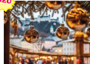
MOTIV 24-03 Glaskugeln