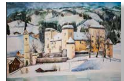
MOTIV 20-37 Schloss/Kirche Goldegg Johanna Kopp