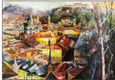
MOTIV 21-01 Salzburg Altstadtblick Johanna Kopp, Mixed Media Collage