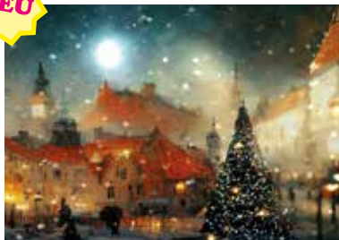
MOTIV 24-04 Winterszene