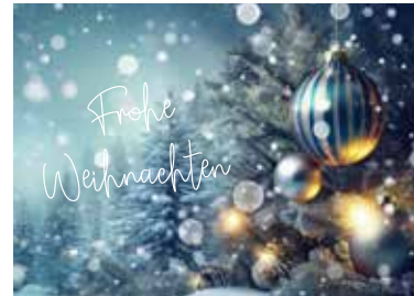
MOTIV 23-03 Winterwald