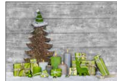
MOTIV 20-18 Frohes Fest