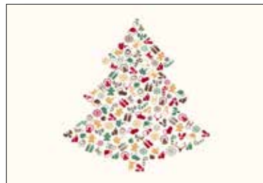
MOTIV 20-33 Weihnachten