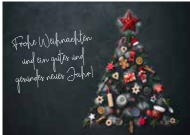
MOTIV 23-01 Weihnachtsbaum Bäckerei