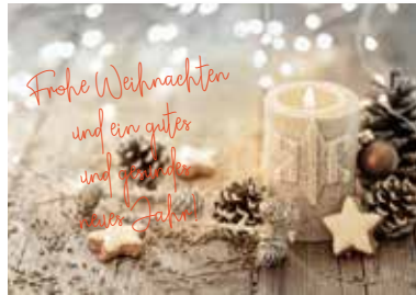
MOTIV 23-02 Weihnachtskerze