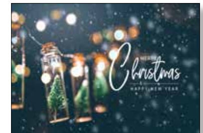
MOTIV 23-10 Merry Christmas