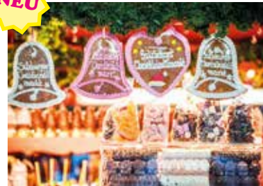
MOTIV 24-02 Weihnachtsmarkt Lebkuchen