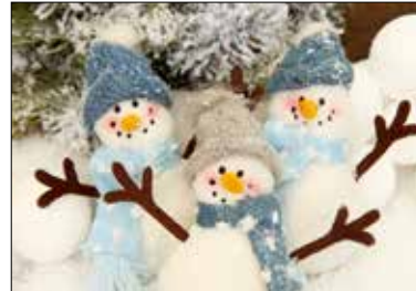
MOTIV 20-10 Schneemänner