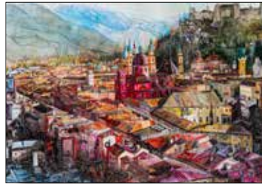
MOTIV 20-01 Altstadtblick vom Mönchsberg Johanna Kopp