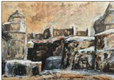
MOTIV 20-25 Salzburg im Winter Christian Andeßner-Angleitner