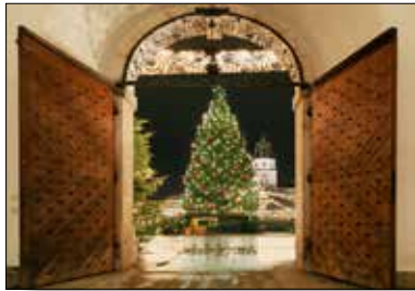
MOTIV 20-20 Blick Christkindlmarkt Salzburg