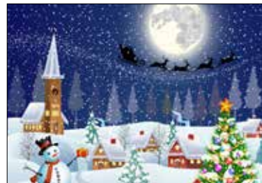
MOTIV 20-15 Fröhliche Weihnachten