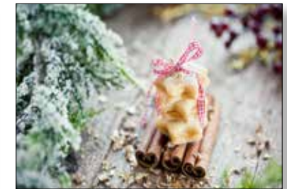
MOTIV 21-09 Ein süßer Gruß