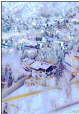
MOTIV 20-35 Gastein im Winter Gerold Karner