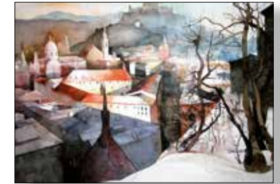
MOTIV 20-24 Blick vom Mönchsberg Johanna Kopp