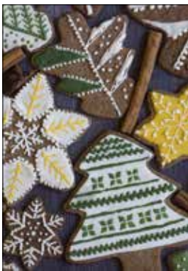
MOTIV 21-06 Weihnachtliche Grüße