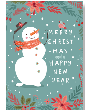
MOTIV 23-07 Schneemann