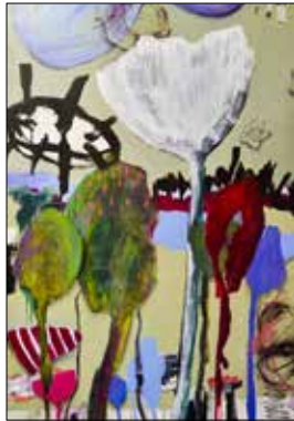
MOTIV 20-05 Herbstausgabe Sabine Schreckeneder