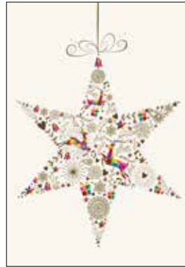
MOTIV 20-16 Weihnachtsstern