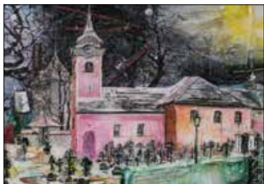
MOTIV 20-31 Winter in St. Jakob