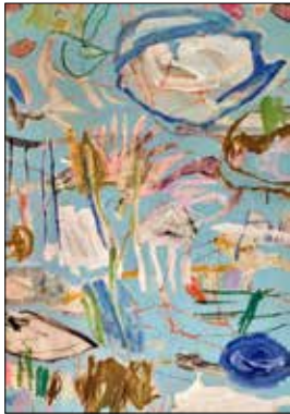
MOTIV 20-04 Zerbrechlichkeit d. Tages Sabine Schreckeneder