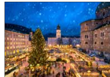
MOTIV 23-08 Christkindlmarkt Salzburg