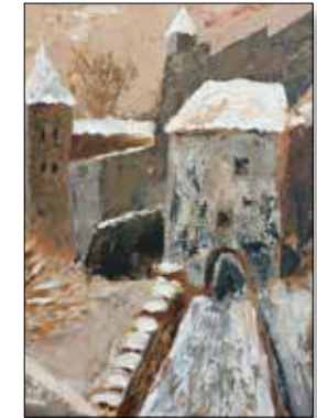
MOTIV 20-32 Festung Salzburg C. Andeßner-Angleitner