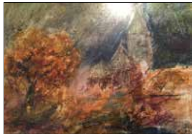
MOTIV 20-26 Mondnacht Christian Andeßner-Angleitner