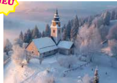
MOTIV 24-05 Kirche in Schneelandschaft