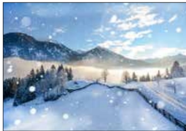
MOTIV 21-04 Winter in den Bergen