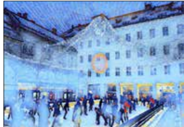
MOTIV 20-09 Eislaufplatz Gerold Karner