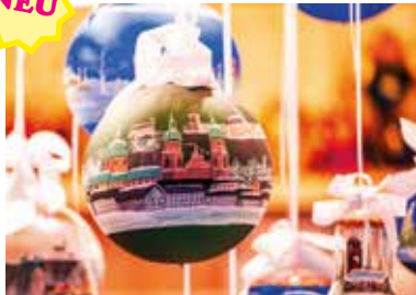
MOTIV 24-01 Glaskugel