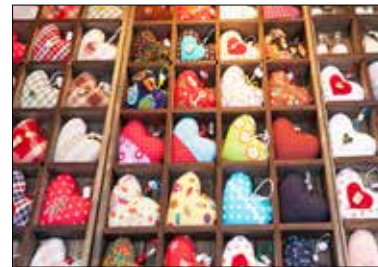
MOTIV 21-07 Von ganzem Herzen