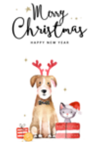
MOTIV 24-07 Tierisches Weihnachten