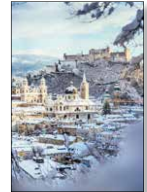
MOTIV 21-05 Winterliches Salzburg