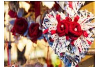
MOTIV 21-08 Ich denke an Dich