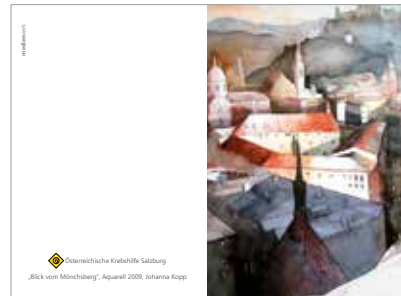
GESCHENKANHÄNGER 6-fach sortiert, gelocht