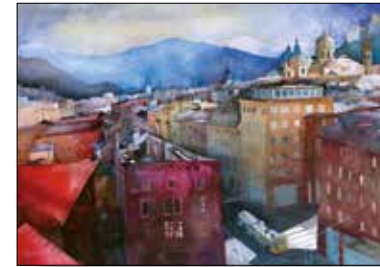
MOTIV 20-23 Blick in die Griesgasse Johanna Kopp