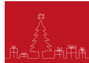
MOTIV 23-04 Frohe Weihnachten