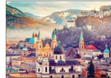
MOTIV 21-03 Blick über Salzburg