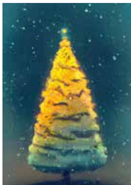
MOTIV 23-09 Tannenbaum im Licht