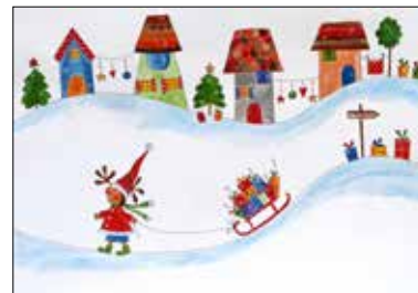
MOTIV 20-34 Verschneites Dorf