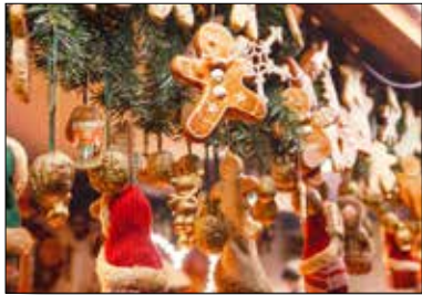
MOTIV 21-10 Grüße vom Christkindlmarkt