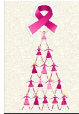
MOTIV 20-17 Pink Ribbon Baum